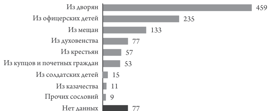
Распределение погибших офицеров по происхождению:

С получением первого чина (подпоручика, корнета, хорунжего) офицер пользовался правами личного дворянства, вне зависимости от его происхождения. Однако совокупность собранного материала позволяет представить долю участия разных сословий в формировании офицерского корпуса.