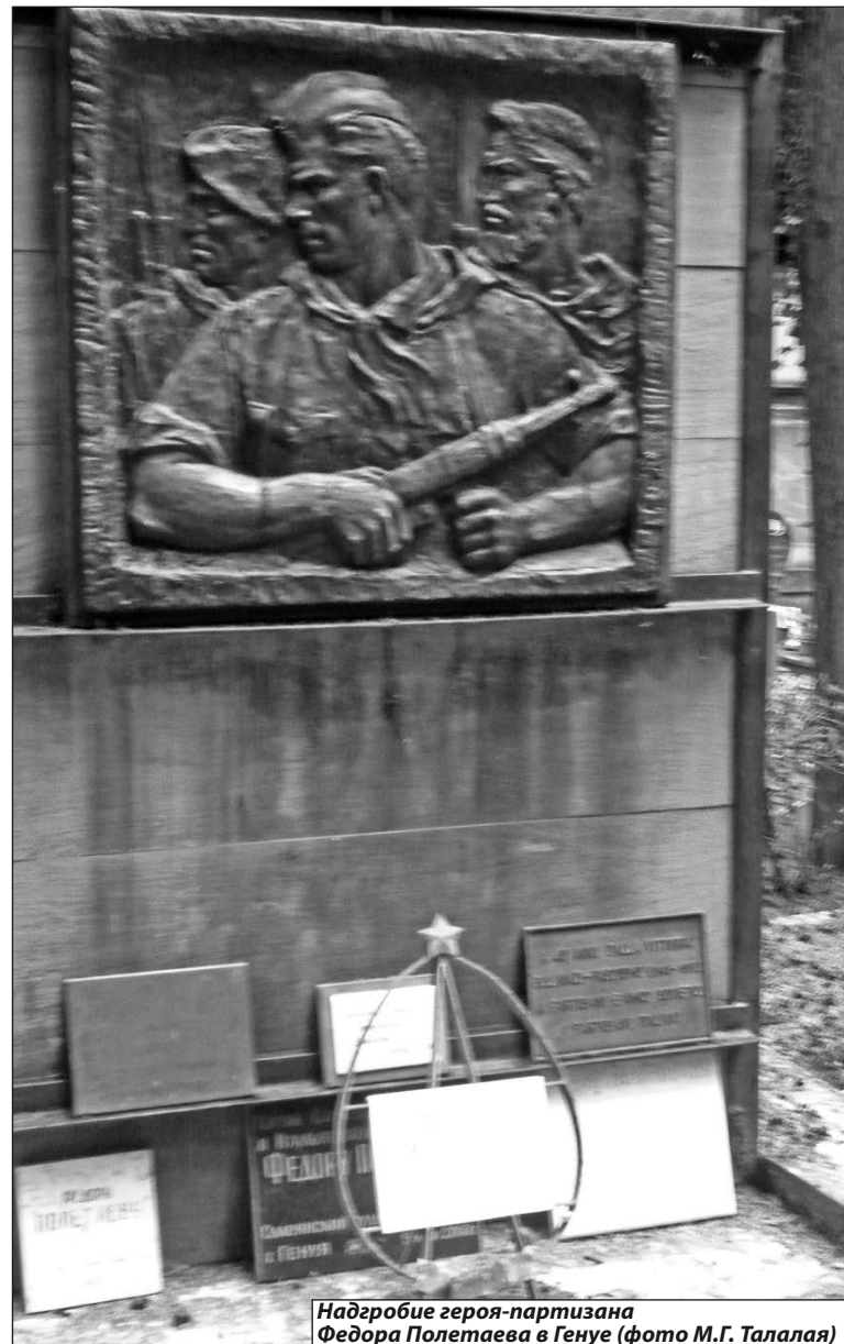
Надгробие героя-партизана Федора Полетаева в Генуе

Всего советских участников Итальянского Сопротивления было более пяти тысяч. Имена и биографии многих из них более-менее известны широкой публике, в первую очередь, знаменитый Герой Советского Союза и Итальянской Республики Федор Полетаев.